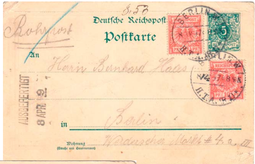
Abb. DR Postkarte 5 Pf. mit 2x 10 Pfennig Zusatzfrankatur als Rohrpostkarte innerhalb Berlins befördert. Das Besondere ist der Zudruck vom Todestag des Generalpostmeisters Heinrich von Stephan. Der Versand erfolgte am gleichen Tag (8 50 N), Stempel AUSGEFERTIGT auch vom 8. April 1897. Danach wird die Karte wohl noch zugestellt worden sein am Werderschen Markt 4 a.