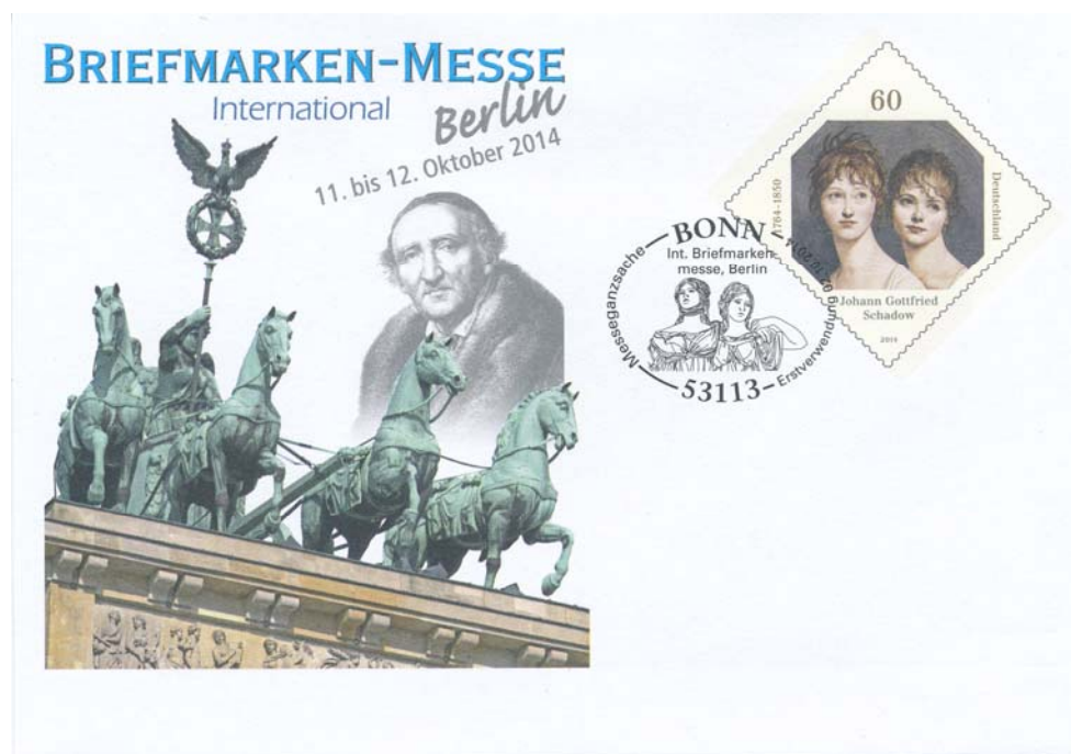
Abb. Vorausentwertete Ganzsache von 2014. Portrait von J. G. Schadow und dreien seiner Werke (Ausschnitte).

Wer eine kleine Berlin-Reise mit einem Museumsbesuch verbinden möchte, dem empfehle ich die hochgelobte Schadow-Ausstellung in der Alten Nationalgalerie (Museumsinsel). „Johann Gottfried Schadow. Berührende Formen.“ ist bis zum 19. Februar zu sehen. Im Mittelpunkt der Ausstellung stehen natürlich die verschiedenen Varianten des Doppelstandbildes (Prinzessinnengruppe) von Luise und Friederike: von Geburt Prinzessinnen von Mecklenburg-Strelitz, durch Heirat Prinzessinnen von Preußen, dabei erstere Kronprinzessin und später Königin. Was ich in der Ausstellung gelernt habe? Der Wertstempel der Ganzsache zeigt auf dem Gemäldeausschnitt nicht die Prinzessinnen sondern ein anderes Geschwisterpaar, deren Namen ich nicht genau erinnere (von? Böhmer?).