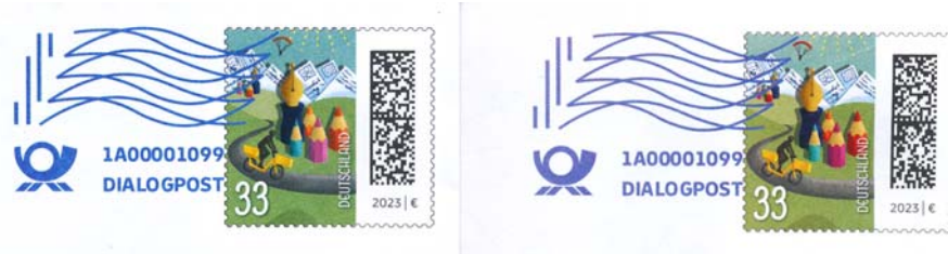
Abb. 33-C-Wertstempel mit Vorausentwertung in verschiedenen Blautönen (links o. Fenster) mit Ziffer 1A00001099 über Dialogpost.

33 C. C6/5 mit Fenster, VE Dialogpost in blau, DV 27.10.2022 (200), GOGREEN