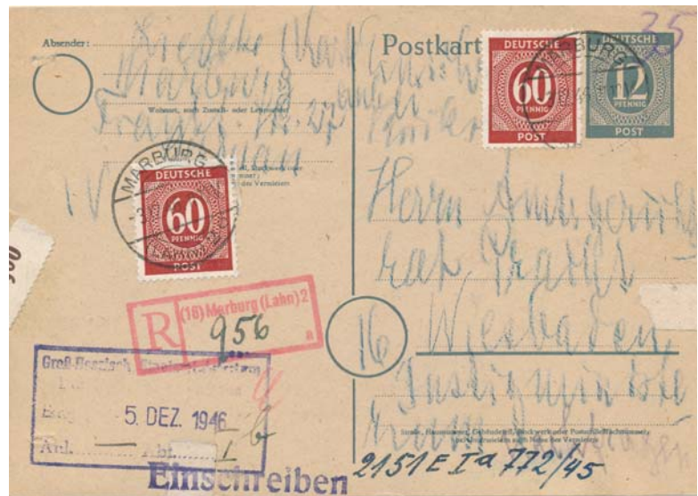
Abb. P 954 mit 2x 60 Pf. Zusatzfrankatur als Einschreiben mit Rückschein bedarfsverwendet.